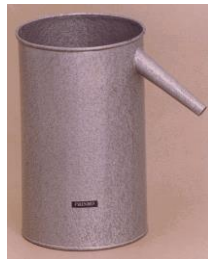
Recipiente para drenagem do líquido deslocado