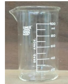
Copo para recolha do líquido deslocado