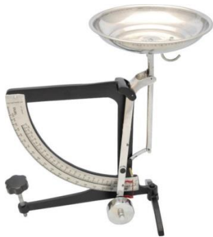
Balança de alavanca